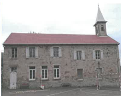
Réfection du clocher et du toit de l'ancienne école d'Eboulet