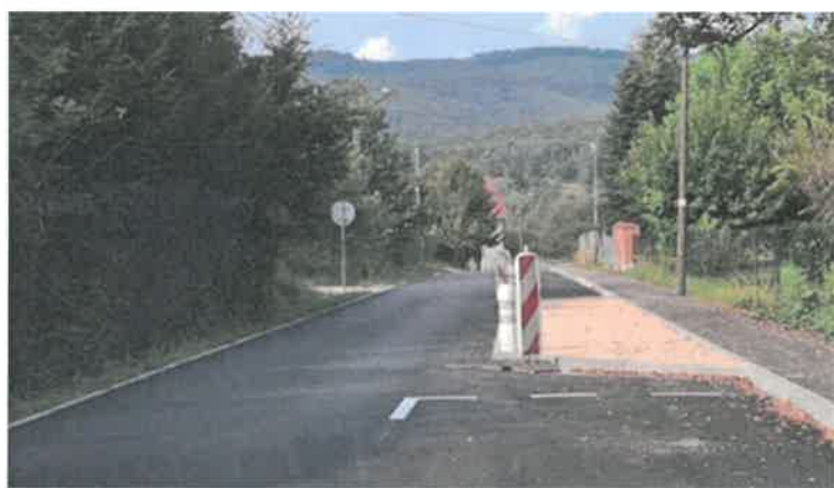
Réfection Rue Senghor