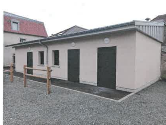
Extension Maison de la Négritude